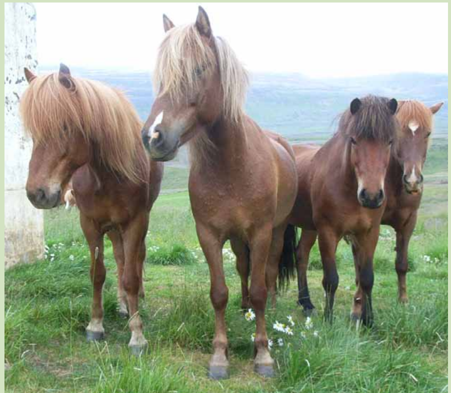
Kraftur, Auður, Prins, Kórall og svo Sóldögg flotta, komin heim og sjálfsagt hvíldinni fegin.