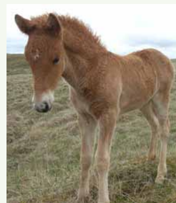
Sonur Plötu og Arðs frá Brautarholti.