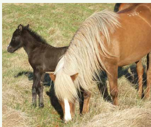
Sonur Kórónu og Tenórs frá Túsbergi.